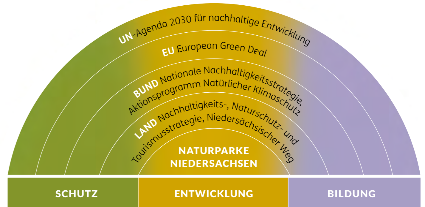
Abb.: Legitimation der Naturpark-Arbeit durch internationale und nationale Verpflichtungen (Darstellung neuland*)

Zum Vergleich gab es in Niedersachsens Naturparks im Jahr 2020 im Durchschnitt 1,8 Stellen und ca. 2,2 befristete Projektstellen pro Naturpark.